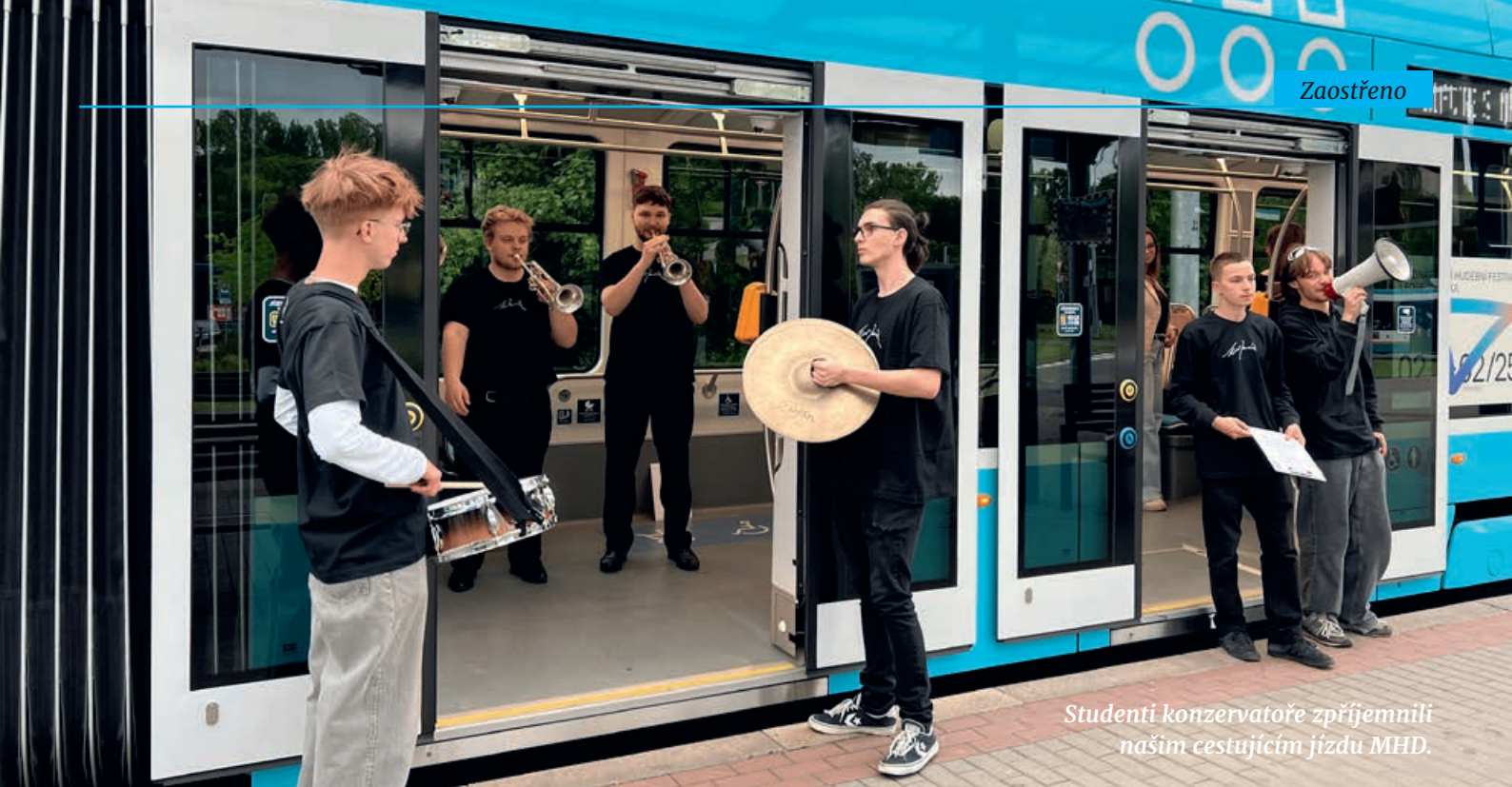
Studenti konzervatoře zpřijemnil našim cestujícím jízdu MHD.