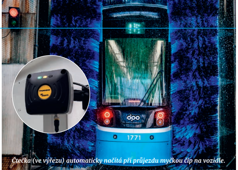
Čtečka (ve výřezu) automaticky načítá při průjezdu myčkou čip na vozidle.

Před rokem a půl jsme se rozhodli zavést systematickou evidenci průjezdnosti vozidel přes myčky na jednotlivých provozovnách. Pilotní program jsme spustili na středisku autobusy Poruba.