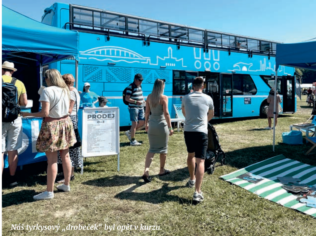
Náš tyrkysový „drobeček“ byl opět v kurzu.

a vezly desítky nadšených rodinek s dětmi, zvědavce i milovníky MHD.