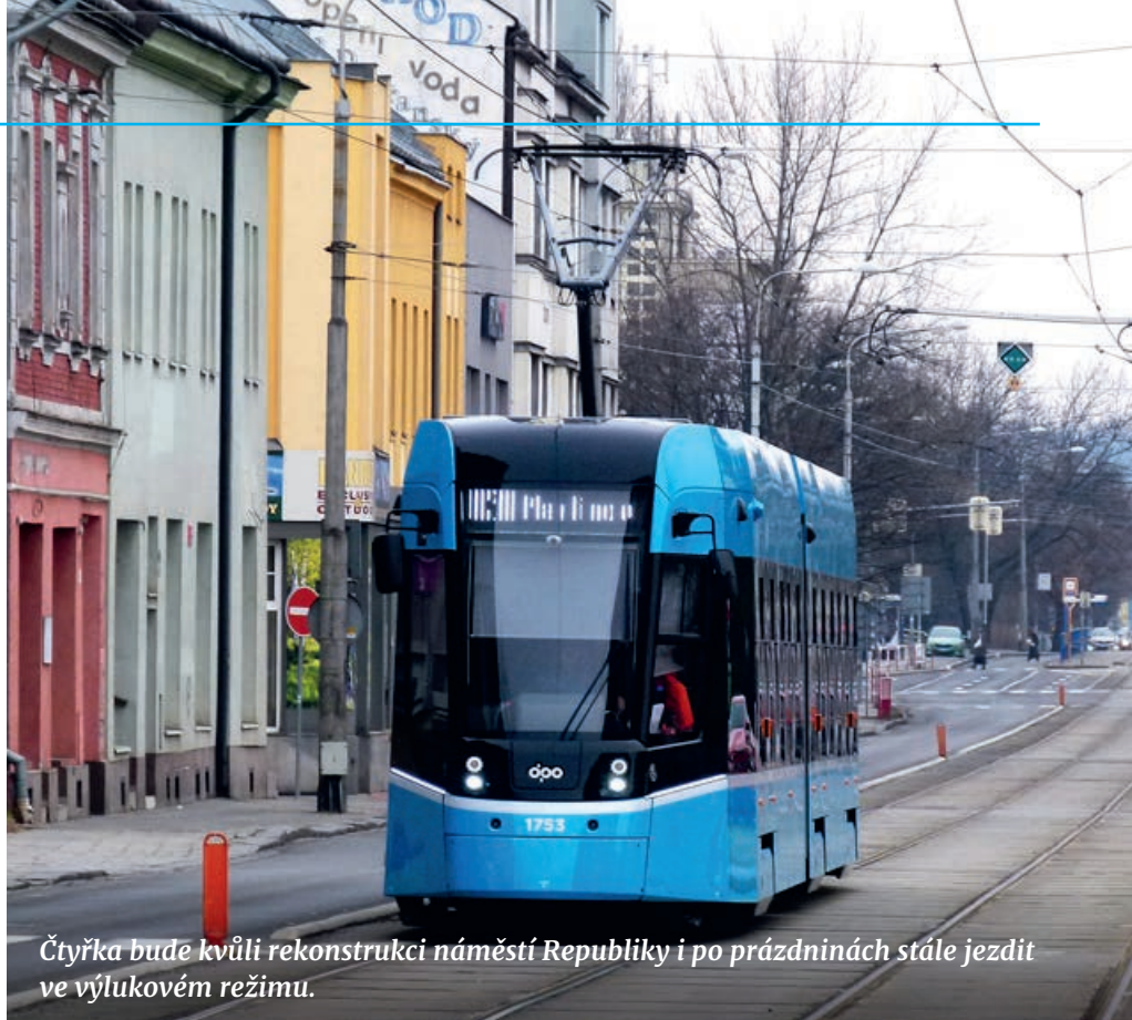
Čtyřka bude kvůli rekonstrukci náměstí Republiky i po prázdninách stále jezdit ve výlukovém režimu.

U několika linek dochází k úpravám jízdních dob, především v ranní a odpolední špičce, které reflektují skutečný provoz v ulicích města a pomáhají zajišťovat pravidelnější průjezd klíčovými úseky. Významná změna se týká linky číslo 40: spoje s příjezdem na zastávku Poruba, vozovna ve 20:24, 20:44, 21:04 a 21:24 budou nově na této zastávce ukončeny. Dále budou pokračovat jako linka 58 až na zastávku Fakultní nemocnice. Tento režim zlepší večerní pokrytí linky 58.