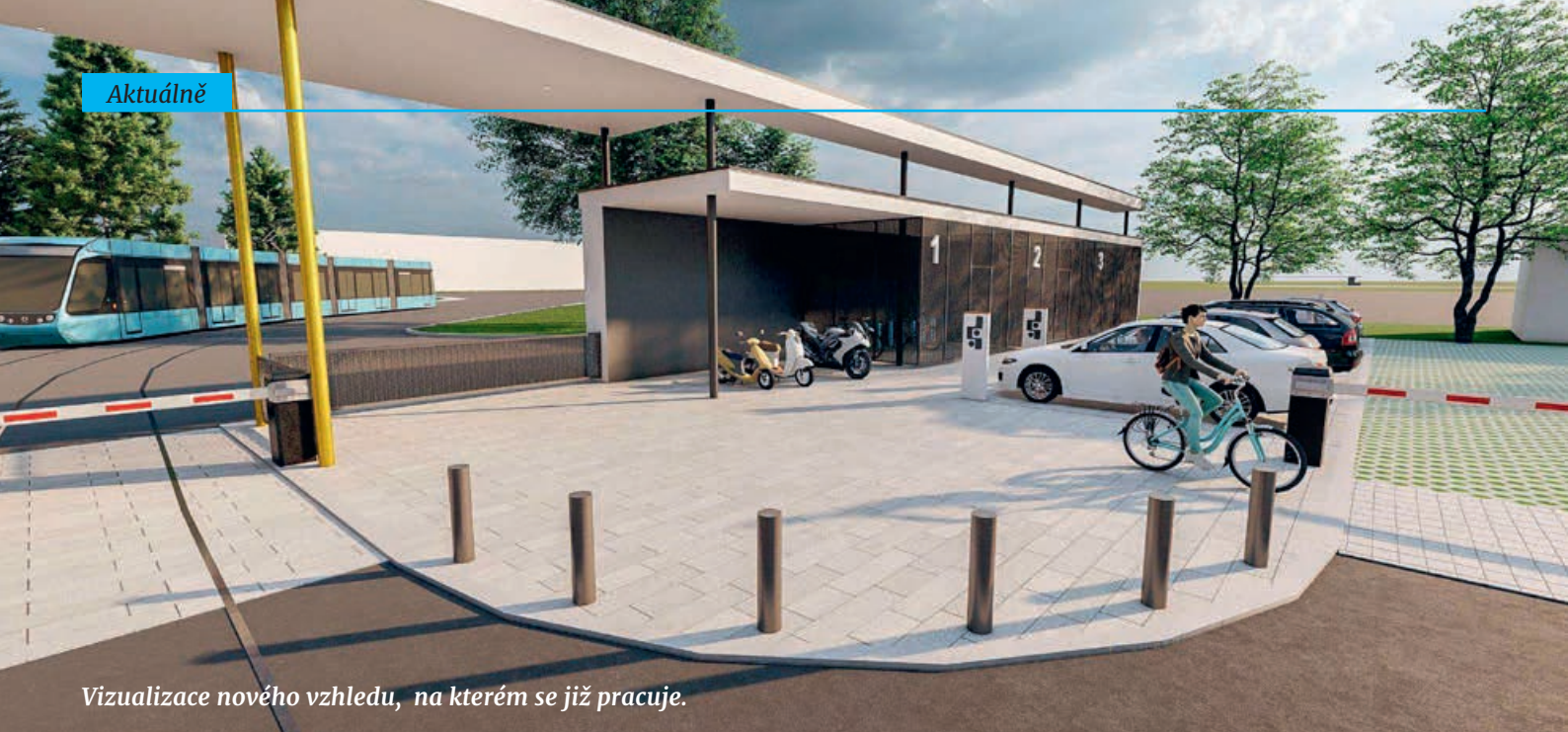
Vizualizace nového vzhledu, na kterém se již pracuje.